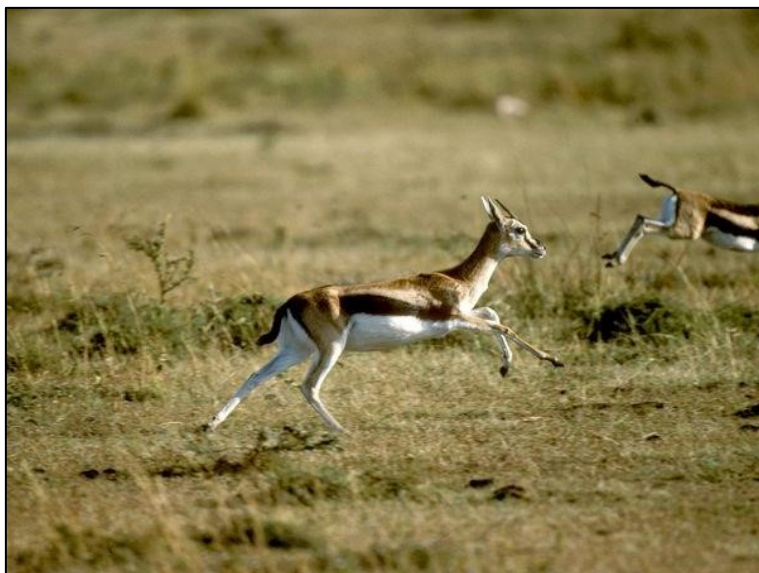
איור 607: צבי תומסון

וחוץ מזה, כיצד יכול מישהו להסתתר מאחורי קירות נמוכים כל כך, מבלי שהחיה תבחין בו? נבחן כעת את הזרועות. הן נמוכות כל כך שאינן יכולות לחסום חיה המנסה להימלט על נפשה!