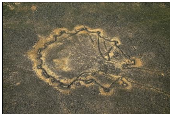
איור 608: האם אלה מלכודות?